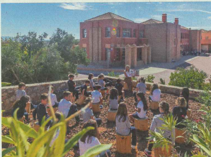
Υπαιθριο μάθημα στο νέο campus του Pierce, στα Σπάτα.