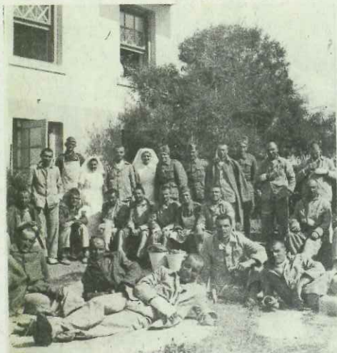
Αριστερά: Στον Ελληνοϊταλικό Πόλεμο, το κολέγιο Pierce χρησιμοποιήθηκε ως στρατιωτικό νοσοκομείο. Στη μέση: Το κτίριο όπου στεγάστηκε το American Junior College for Girls, στο Παλαιό Φάληρο, το 1923. Δεξιά: Ο πρόεδρος του Αμερικανικού Κολλεγίου Ελλάδος, δρ Ντέιβιντ Τζ. Χόρνερ.

Για πολλές ημέρες, άγρυπνη και πεισματικά ψύχραιμη, βοήθουσε όπως μπορούσε τους κατατρεγμένους, ανάμεσα στους οποίους υπήρχαν πολλά νεογέννητα, ενώ μια γυναίκα έφερε στον κόσμο ένα μωρό μέσα στο σχολείο. Όταν η φωτιά έζωσε το κτίριο και οι Αμερικανοί διέταξαν εκκένωση, η Μίνι Μιλς τα στύλωσε: «Δεν πηγαίνω πουθενά δίχως τις μαθήτριάς μου!»