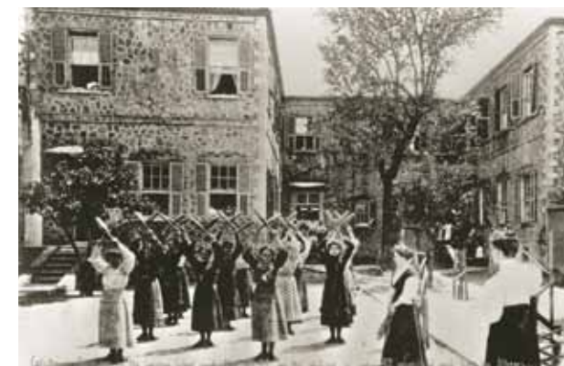
Μάθημα Φυσικής Αγωγής στη Σμύρνη, 1900

• 1932 – Εγκαινιάζονται στο Ελληνικό οι καινούργιες εγκαταστάσεις του Κολλεγίου, σε έκταση που παραχωρεί η Ελληνική κυβέρνηση, εκτιμώντας την ποιότητα του εκπαιδευτικού του έργου.