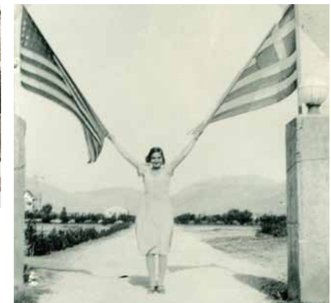
Κεντρική πύλη στο campus του Ελληνικού