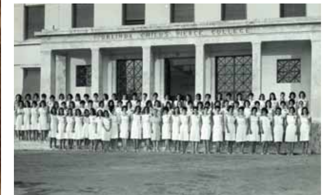
Τελετή αποφοίτησης του Pierce, 1963

Ζωντανή κληρονομιά των αξιών αυτών, οι περισσότεροι από 9.900 απόφοιτοι του Pierce που διακρίνονται εντός και εκτός της χώρας, όχι μόνο για τις επαγγελματικές τους ικανότητες, αλλά και για την ευρύνοια, το προοδευτικό πνεύμα και την κοινωνική τους στάση.